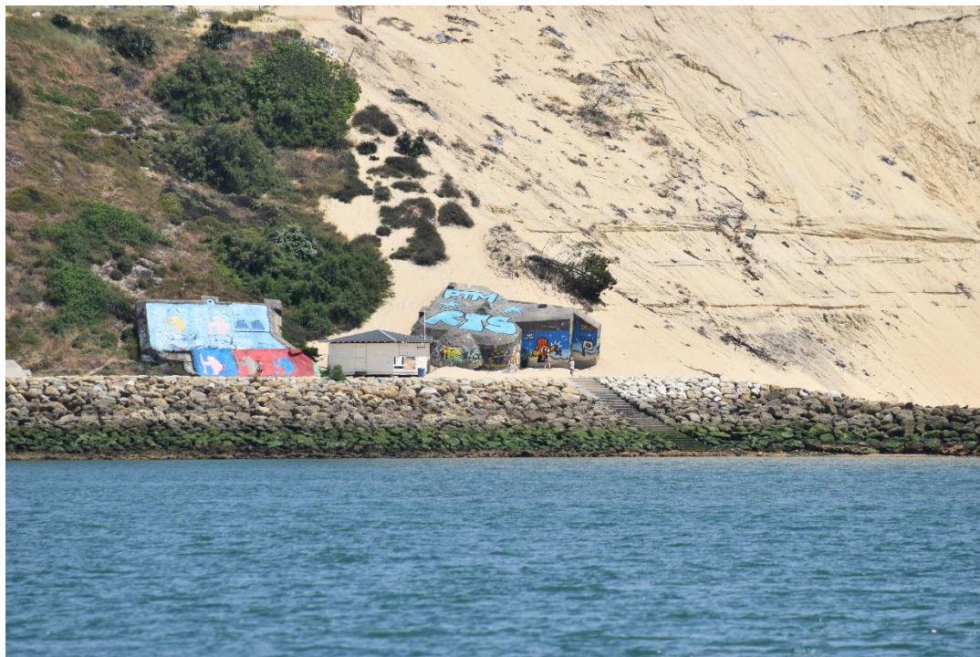
Amer cité à l'article 1 - limite nord Blockhaus au pied du lieu-dit « La Corniche »