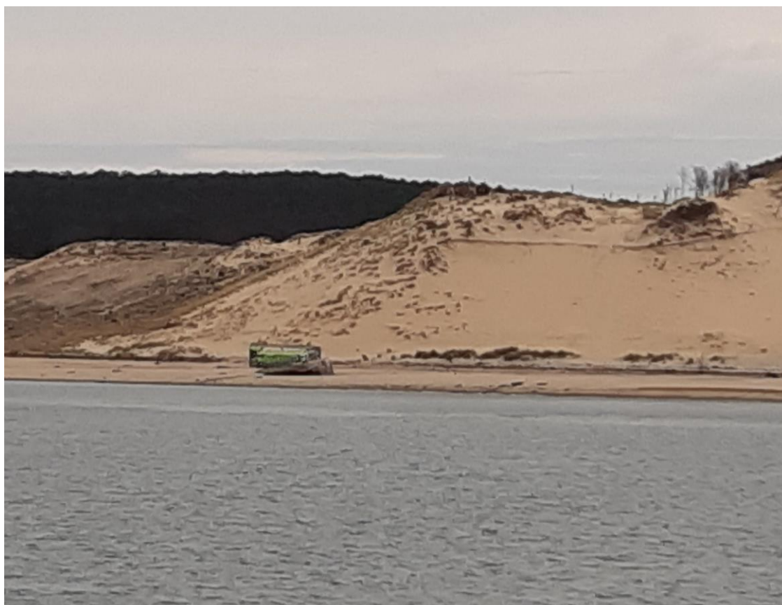
Amer cité à l'article 1 - limite sud Blockhaus du Gaillouneys